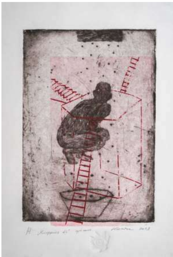
Конструкція №1. 2023. Суха голка. 26x24