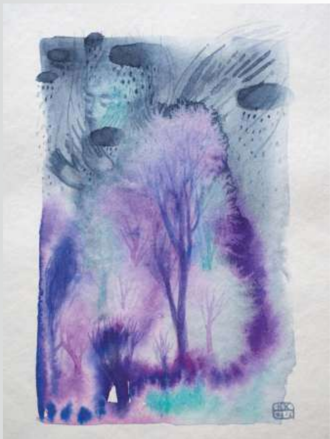
Ангел у дощовому лісі 2022. Папір, акварель. 16x13