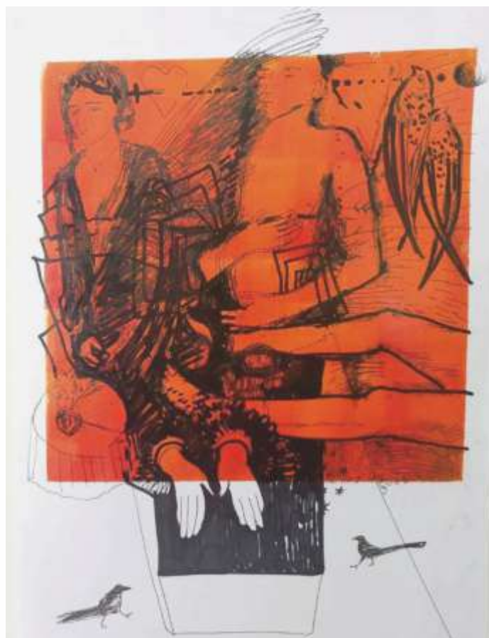
Двоє. 2023. Монотипія, лінер, маркер. 41x30