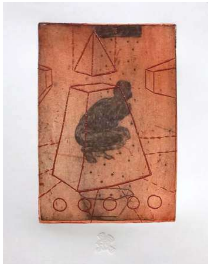
Конструкція №2. 2023. Суха голка. 26x24