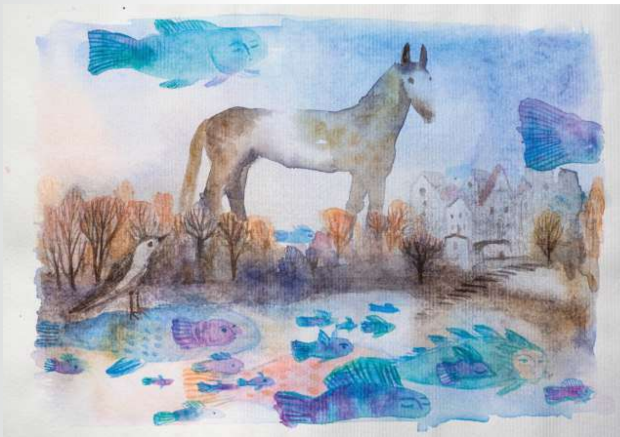
Рибний день. 2022. Папір, акварель. 21х30