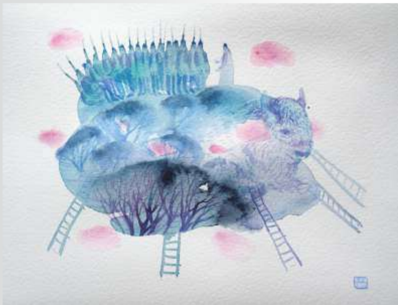
Небесне військо. 2022. Папір, акварель. 13x16