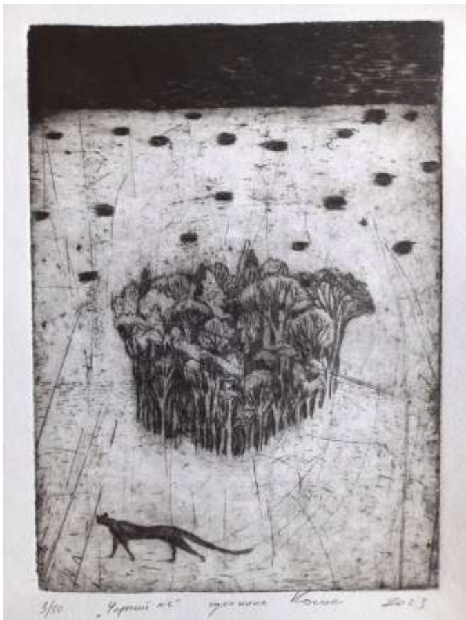
Чорний ліс. 2023. Суха голка. 26x24