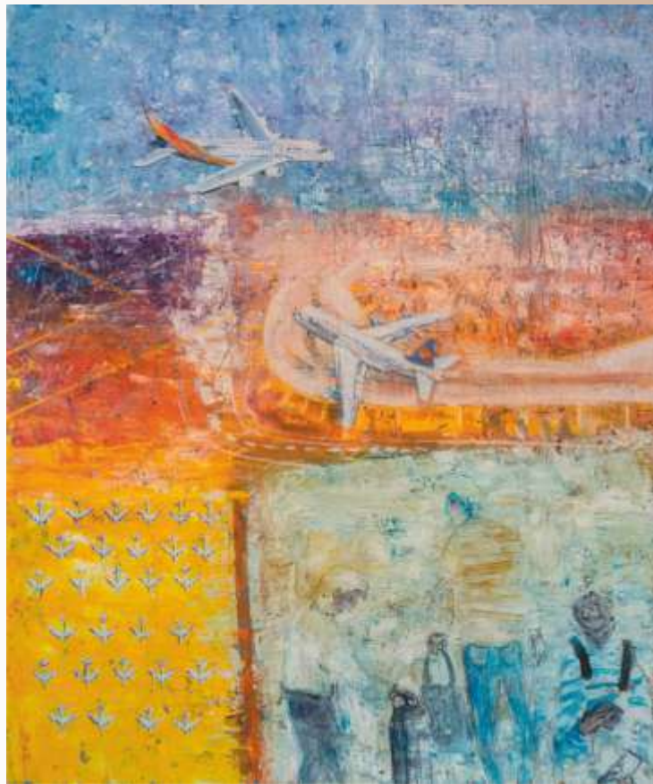
Час відльоту. 2019. Полотно, олія. 40х30