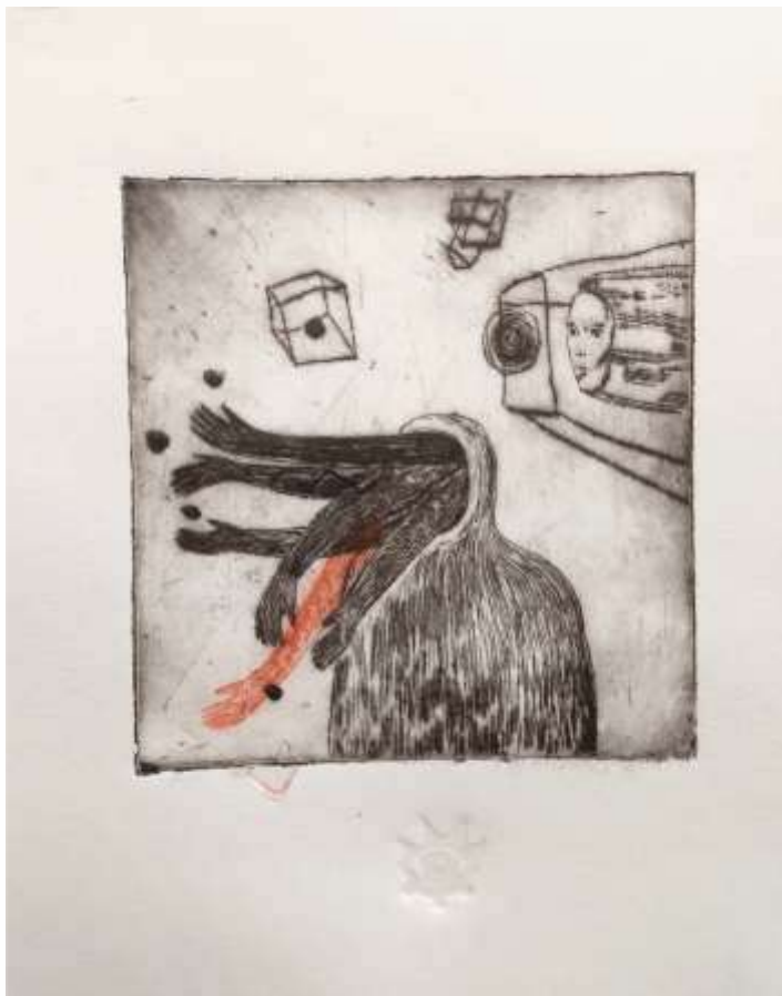
Комунікація. 2023. Суха голка. 24x21