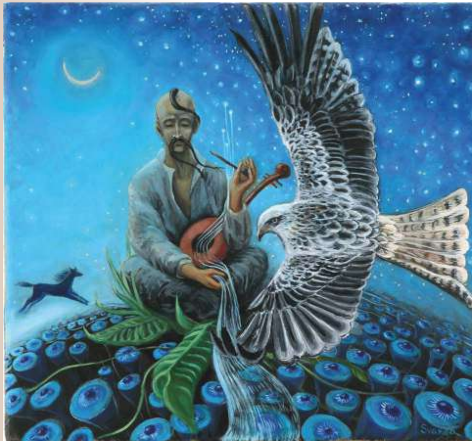
Мамай. 2019. Полотно, олія. 27х27