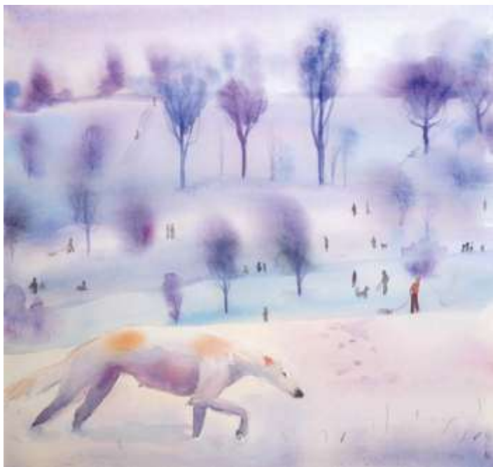
Зимова прогулянка. 2021. Папір, акварель. 30x30