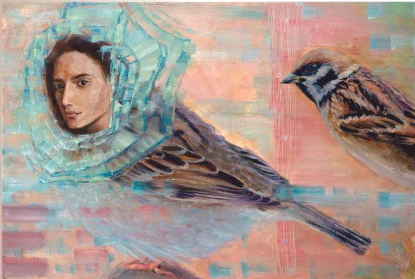
Трансформація. 2020 Полотно, олія. 40x70