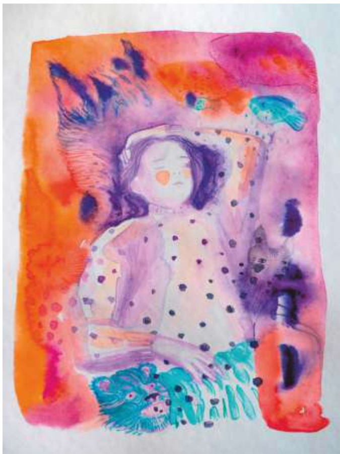
Кольорові сни. 2022. Папір, акварель. 34x25