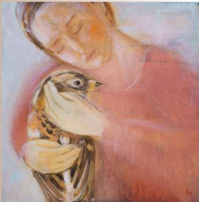
Відпускання. 2021. Картон, олія. 40x40