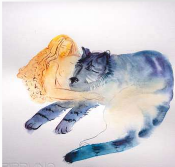
Друг. 2021. Папір, акварель. 20x20