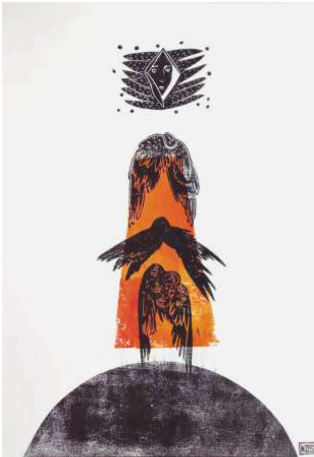
Трансформація. 2023. Ліногравюра. 41х30