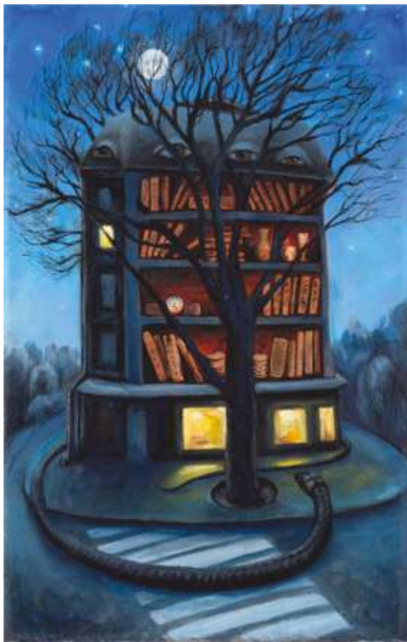
Ввечері 2019. Полотно, олія 27x22