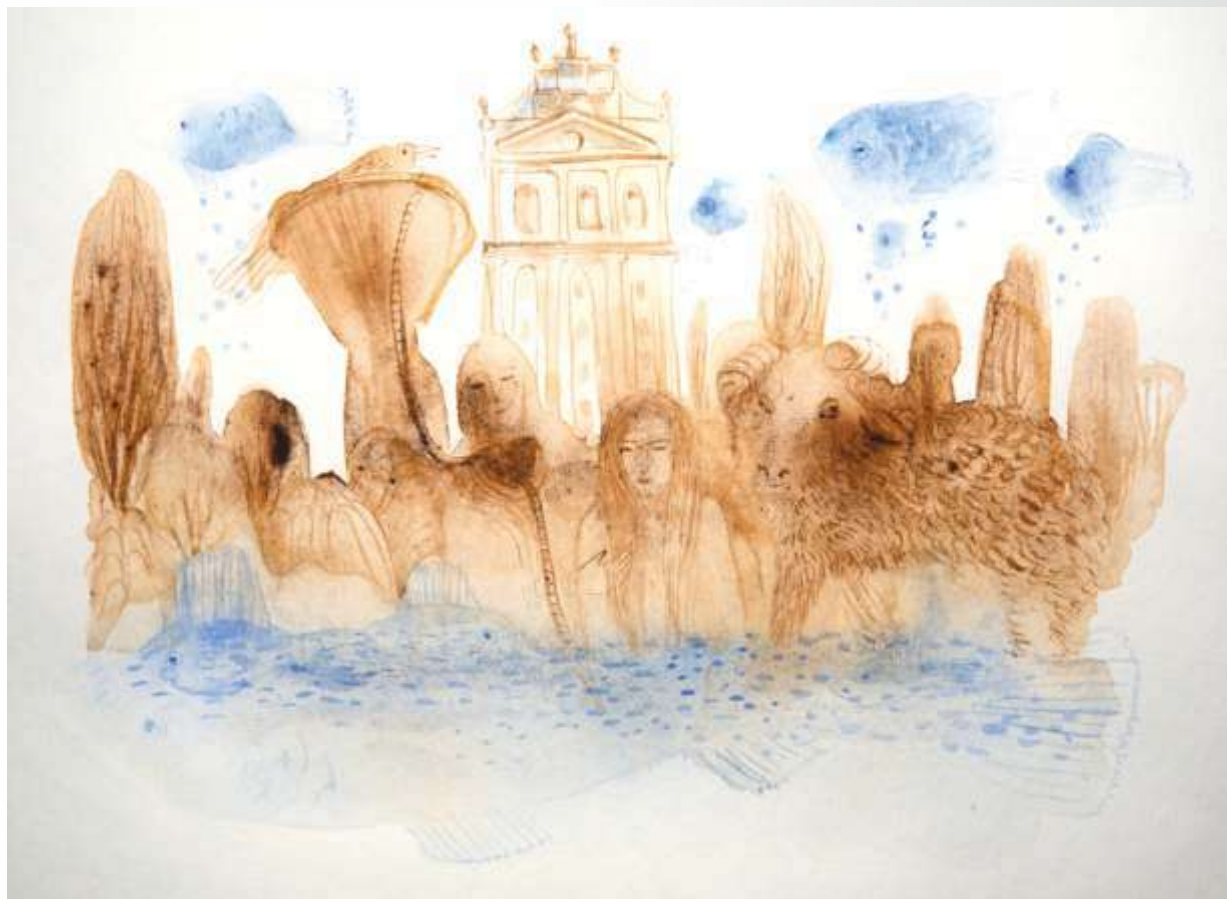
Прибуття до міста N. 2021. Папір, акварель. 20x26