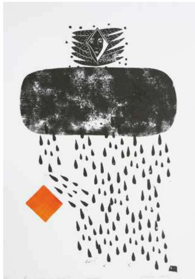
Крізь смуток до надії. 2023. Ліногравюра. 41х30