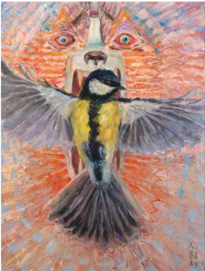
Здоганялки. 2020. Полотно, олія. 40х30