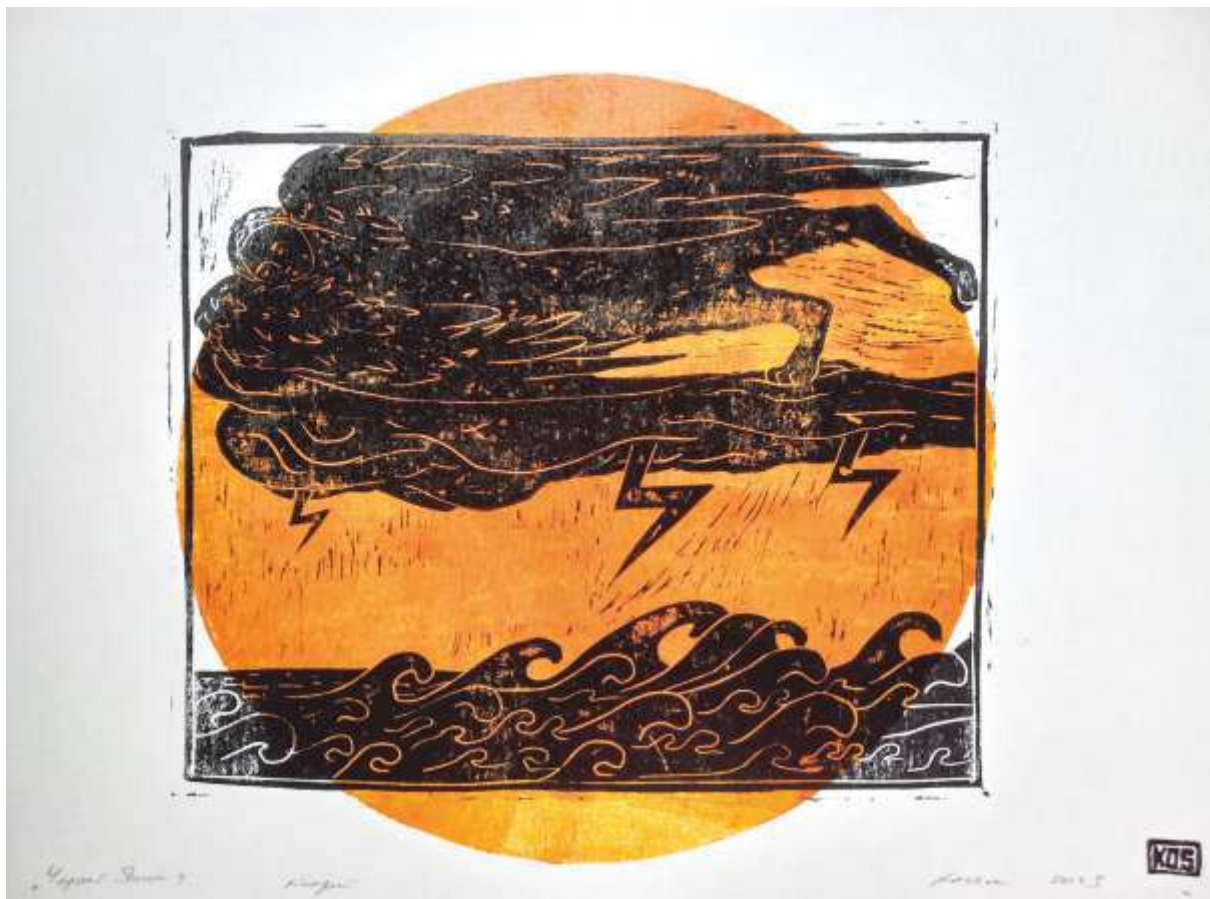
Чорний янгол. 2023. Ліногравюра. 30x41