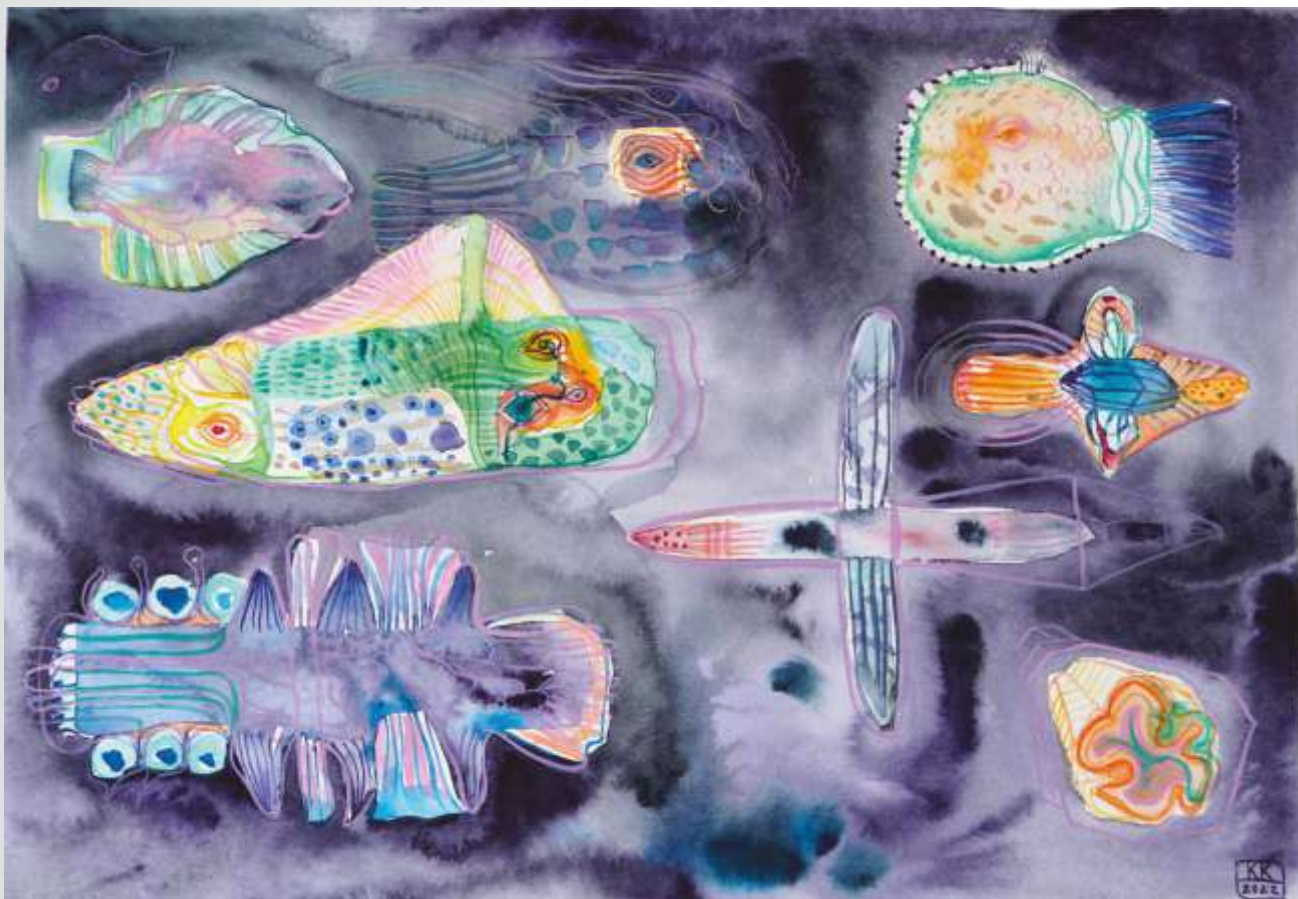
Істоти. 2022. Папір, акварель. 30x41