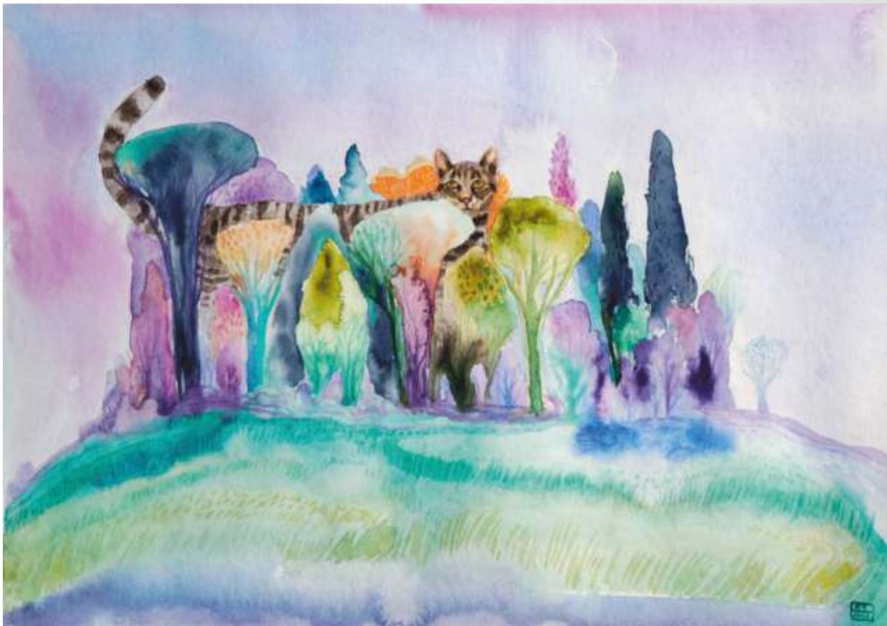
Кіт у лісі. 2022. Папір, акварель. 26x30