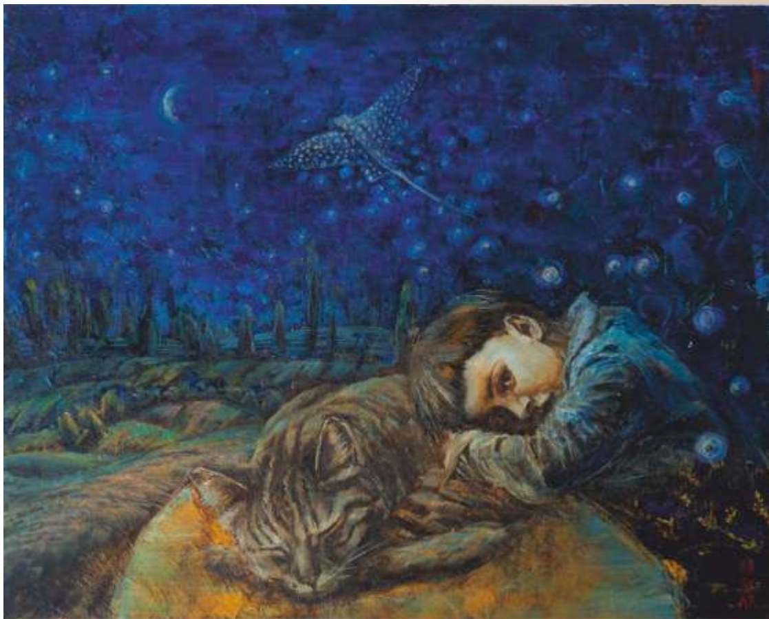
Сон. 2019. Полотно, олія. 30x40