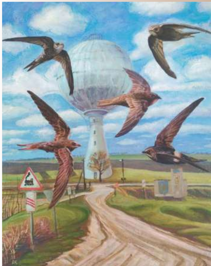
Серпокрилки. 2020. Полотно, акрил, пастель. 50x40