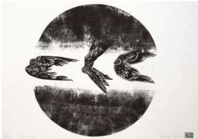
Нема часу. 2023. Ліногравюра, монотипія. 30x41