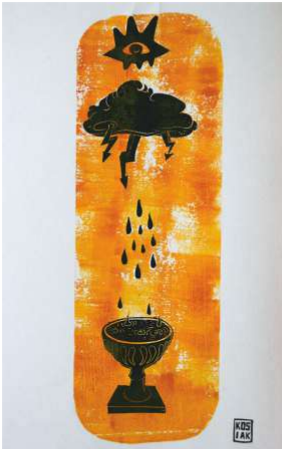
Остання чаша терпіння. 2023. Ліногравюра. 33x17