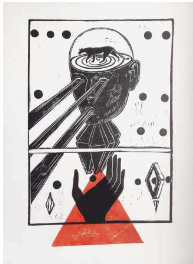
Пантера думок. 2023. Ліногравюра. 41x30