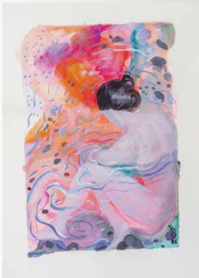
У морі. 2020. Папір, акварель, акрил. 26x17