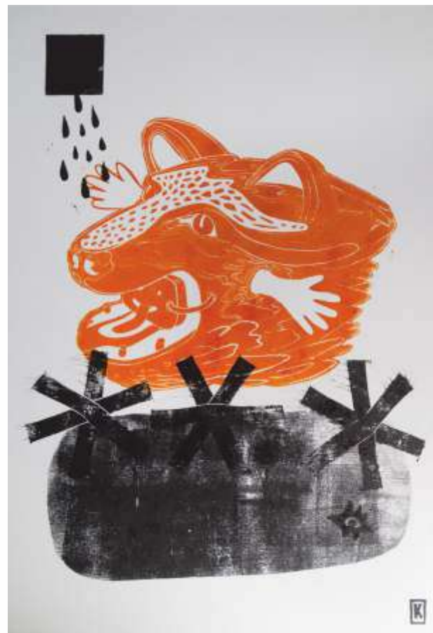
Проходження. 2023. Ліногравюра. 30x41