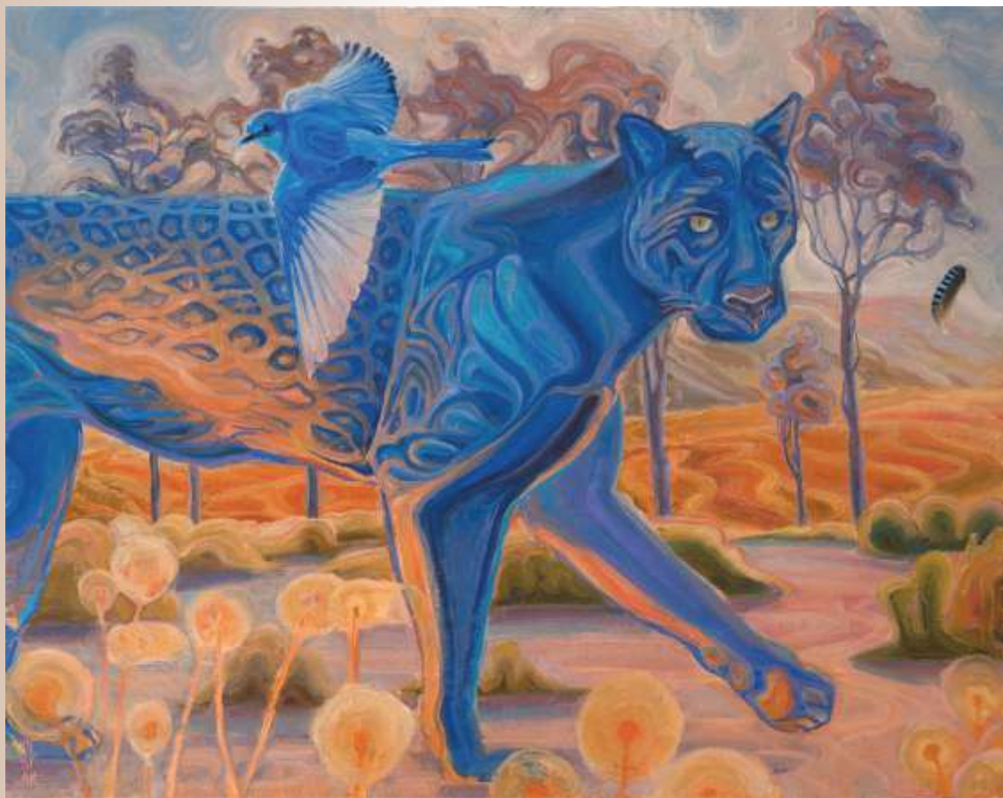
Велика подорож. 2019. Полотно, олія. 70х90