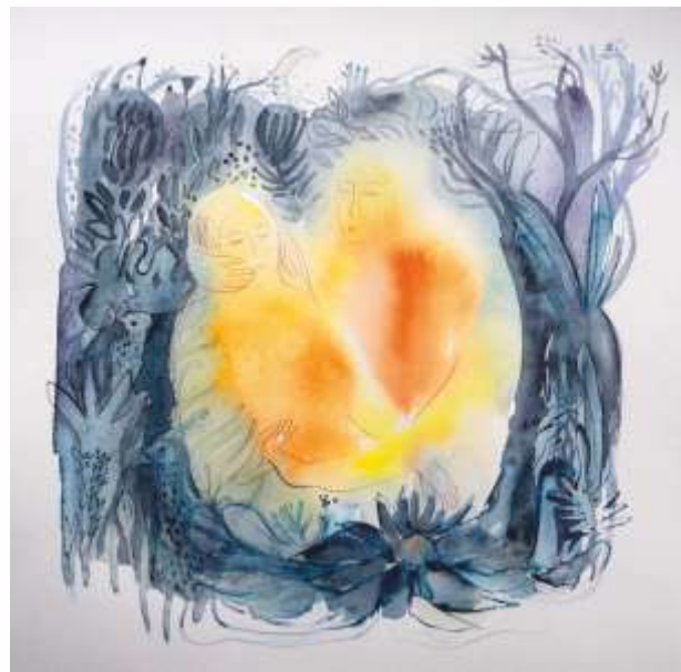
Обійми. 2021. Папір, акварель 20x23