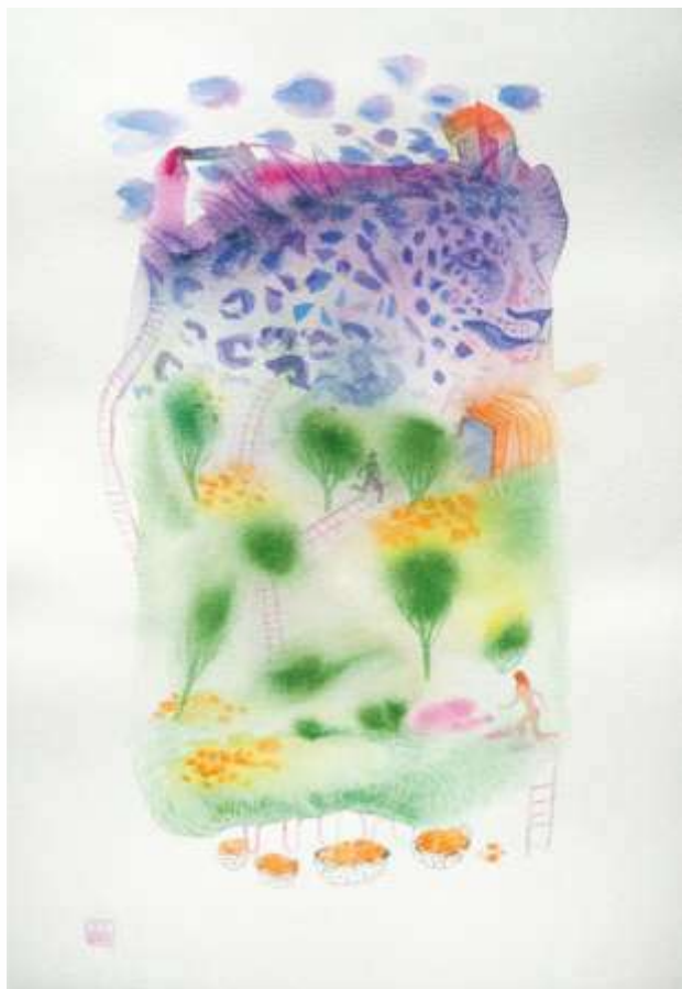
Здоганялки. 2022. Папір, акварель. 26x17