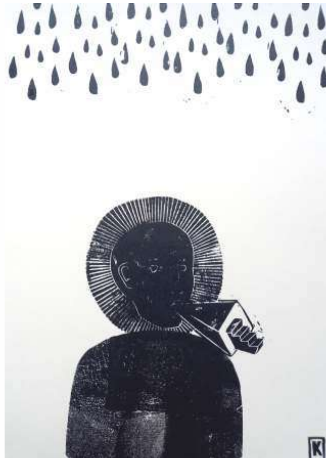
Починається дощ. 2023. Ліногравюра. 30x21