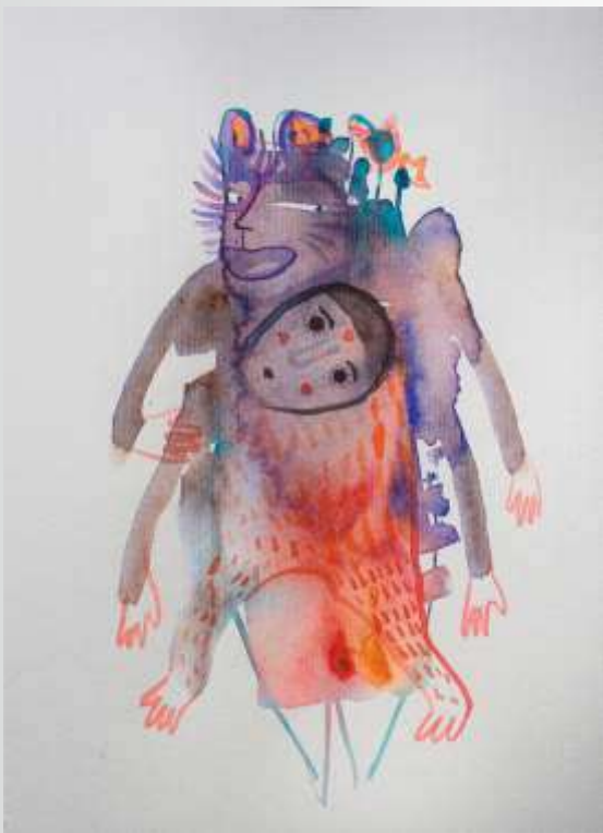
Многорукий. 2022. Папір, акварель. 16x13