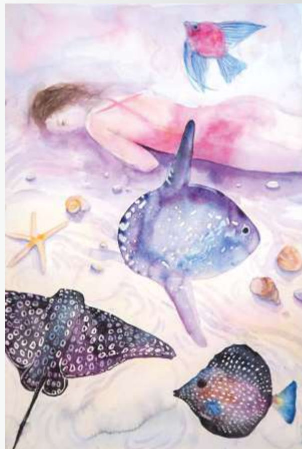
На глибині. 2021 Папір, акварель. 42x34

Оксана Журавель-Надеждіна член Національної Спілки художників України, живописець, лауреат обласної премії у сфері образотворчого мистецтва та мистецтвознавства імені Олександра Осмьоркіна