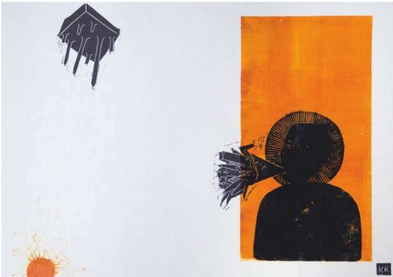
Чорний дощ, 2023. Ліногравюра. 30x41