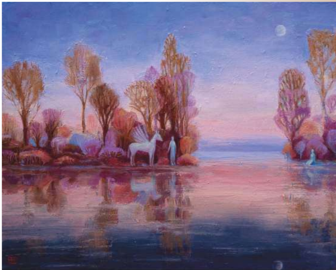
Зустрінемося там, де починається море. 2022. Полотно, олія. 30x40