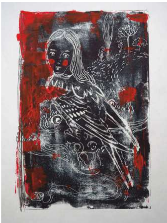
Катання на драконі. 2021. Монотипія. 30x21