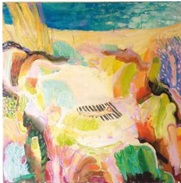
Біля річки. 2021. Полотно, олія. 50x50