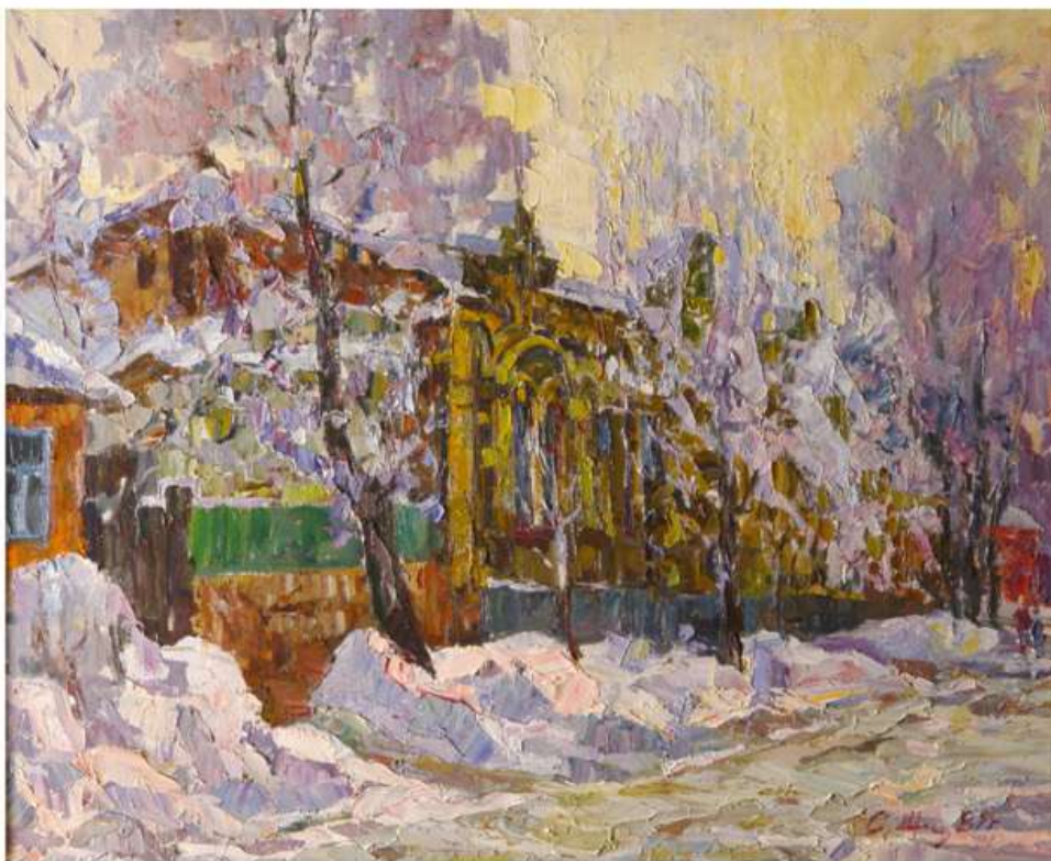
Будинок О.О.Осмьоркіна. Іній. 1989. Полотно, олія. 67x82 Дом А.А.Осмеркина. Иней. 1989. Холст, масло. 67x82 O.Osmerkin's house. Hoarfrost. 1989. Oil on canvas. 67x82