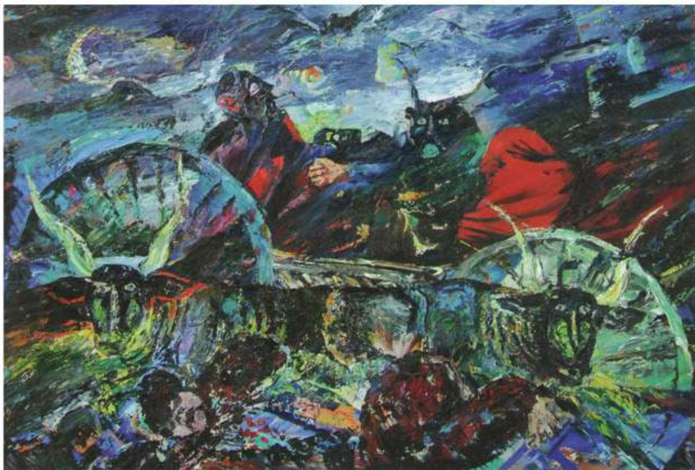
Чумацькі мари. 1990. Полотно, олія. 90x110 Видення чумаков. 1990. Холст, масло. 90x110 Tchoomaks' phantoms. 1990. Oil on canvas. 90x110