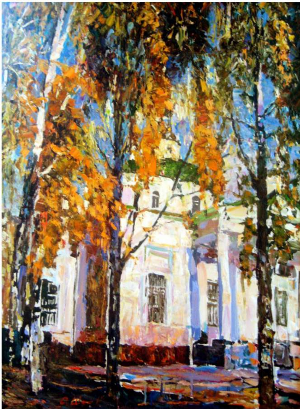
Серпантин осені. 2011. Полотно, олія. 90x67 Серпантин осени. 2011. Холст, масло. 90x67 Serpentine of autumn. 2011. Oil on canvas. 90x67