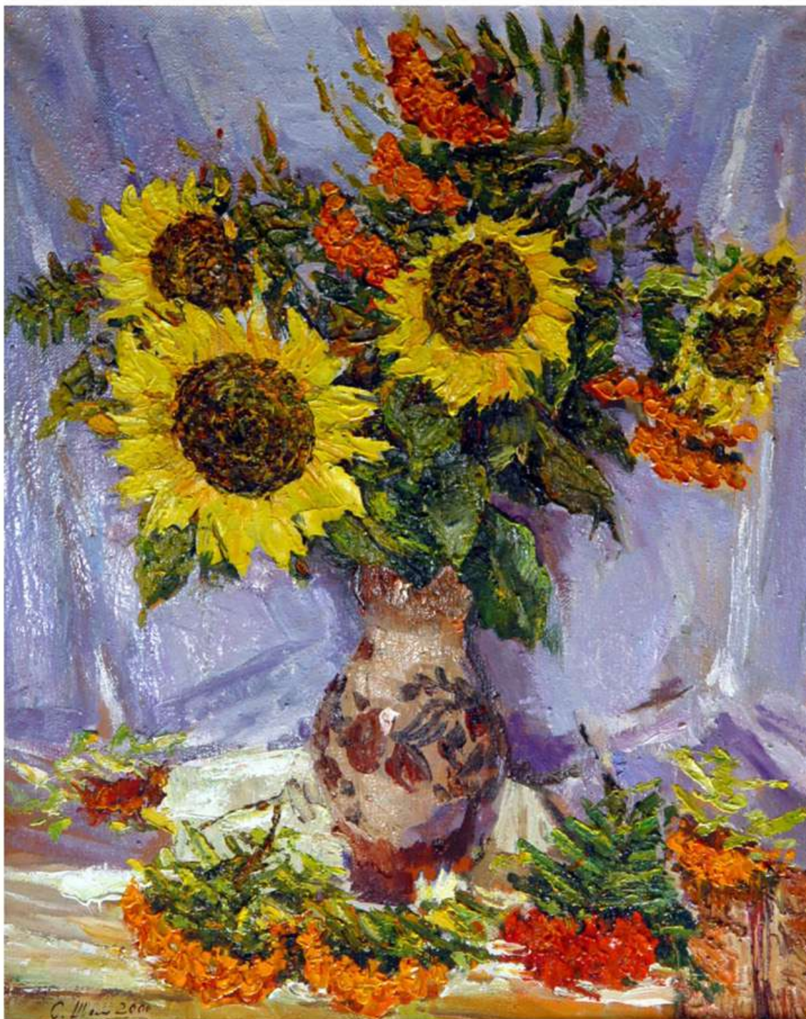
Натюрморт з соняшниками. 2000. Полотно, олія. 73x57,5. Натюрморт с подсолнухами. 2000. Холст, масло. 73x57,5 Still life with sunflowers. 2000. Oil on canvas. 73x57,5