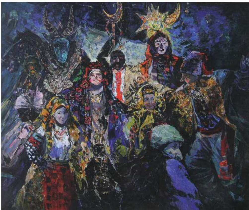
Добрий вечір, щедрий вечір! 1989. Полотно, олія. 100x120. Добрый вечер, щедрый вечер! 1989. Холст, масло. 100x120 Dobryi vechir, schedryi vechir! (Good evening, Epirhany Eve). 1989. Oil on canvas. 100x120