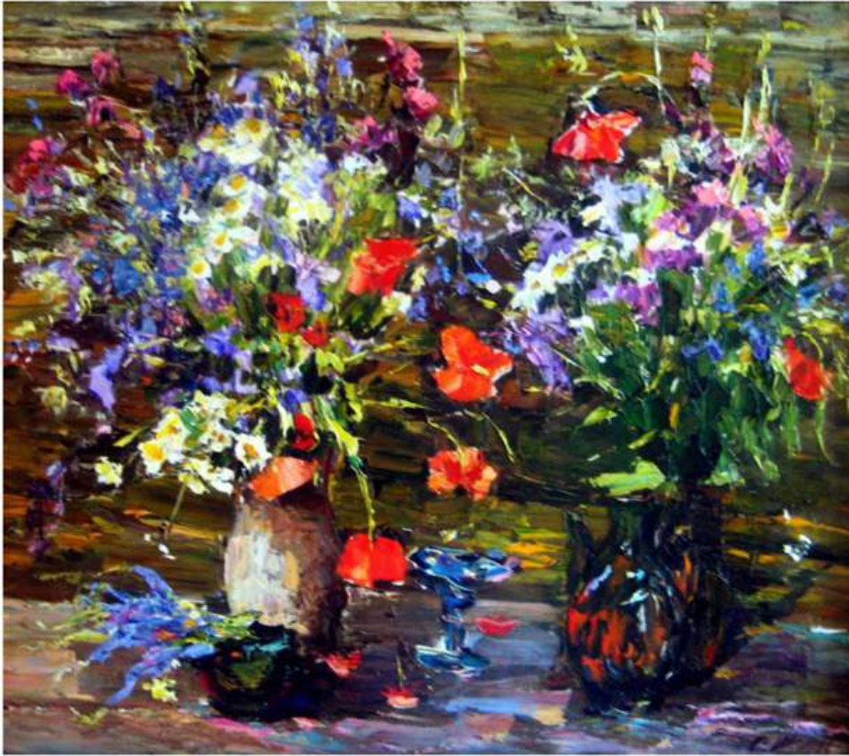
Маки польові. 2011. Полотно, олія. 80x90