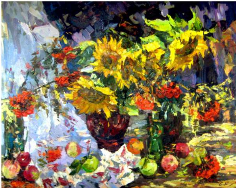
Фарби осені. 2011. Полотно, олія. 80x100 Краски осени. 2011. Холст, масло. 80x100 Colours of Autumn. 2011. Oil on canvas. 80x100