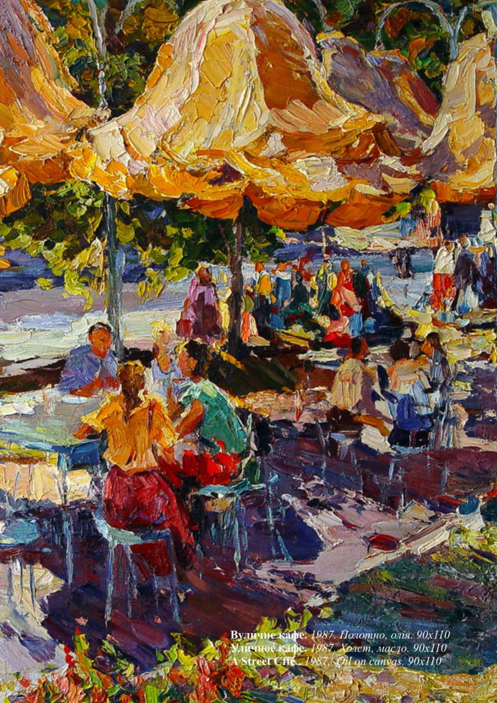
Вуличне кафе. 1987. Полотно, олія. 90x110 Уличное кафе. 1987. Холст, масло. 90x110 A Street Cafe. 1987. Oil on canvas. 90x110