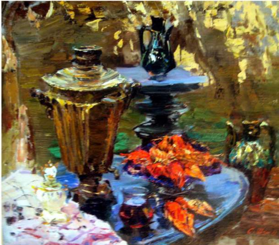
Біля самовару. 2011. Полотно, олія. 80x90