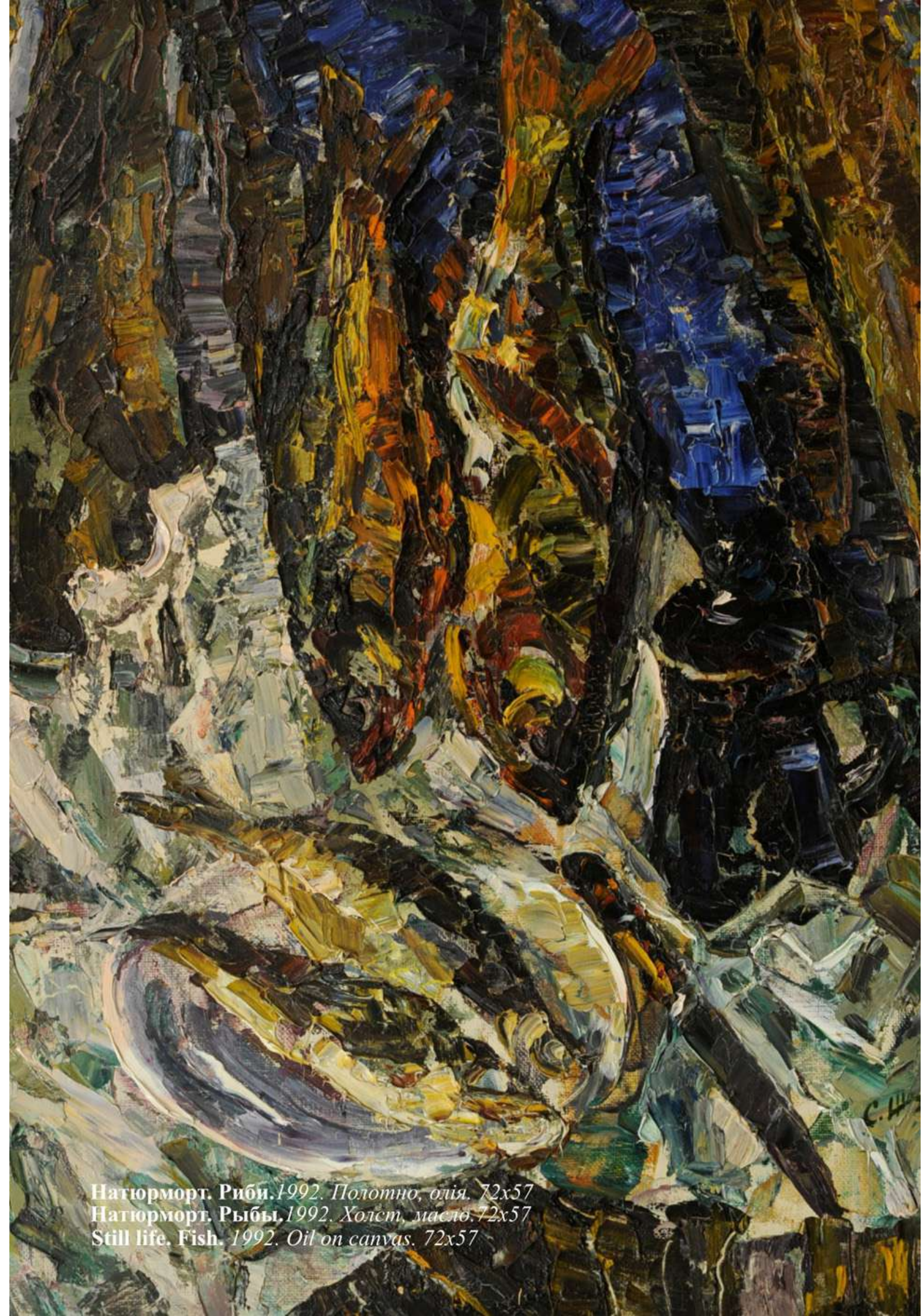
Натюрморт. Рыби. 1992. Полотно, олія. 72x57 Натюрморт. РЫБЫ. 1992. Холст, масло. 72x57 Still life. Fish. 1992. Oil on canvas. 72x57