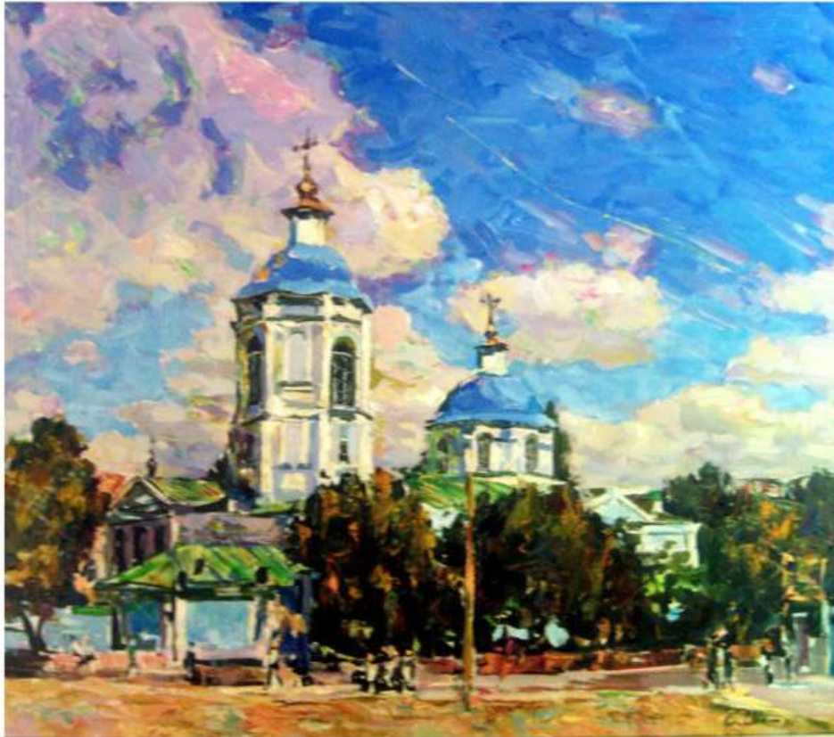
Блакитний дзвін. 2011. Полотно, олія. 75x85 Голубой звон. 2011. Холст, масло. 75x85 Blue ringing. 2011. Oil on canvas. 75x85